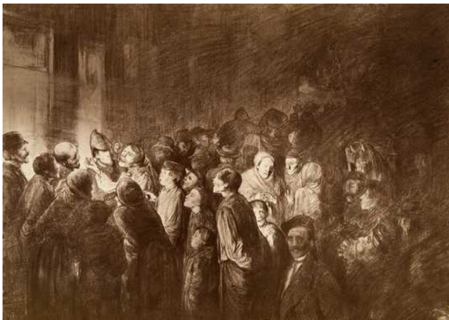
Theodor Kittelsen: Kvalm i gata . Norsk Folkemuseum

I mitt doktorgradsprosjekt vil eg ta for meg utviklinga av politiske aksjonar i Noreg frå rundt midten av 1700-talet til midten av 1800-talet. Eit fokus vil vere på korleis måten folk aksjonerte på – protestrepertoaret, om ein vil – endra seg, og kva som spelte inn i denne utviklinga.